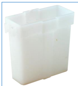
Cubeta de reactivos