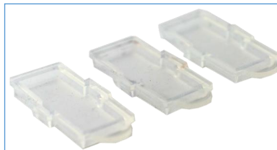
Cubierta individual de silicona