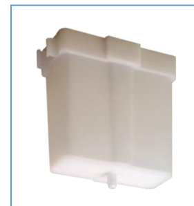
Cubeta de enjuague